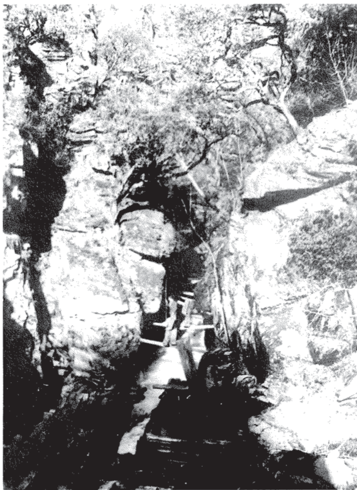
Paso das travesas polo Quello dos Mortos.

En concreto na provincia de Ourense, en Valdeorras, estableceu unha explotación nos montes de Trevinca. Durante sete anos (1943-1949) tallou a masa botánica da finca privada de "La Cabrera".