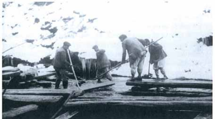
Recuperando travesas no río Casoio. AHF-MFM

Mais, ante o crecemento das necesidades, esten-