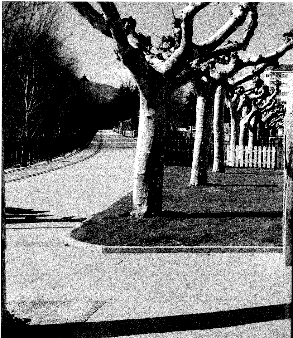
“Castelao” obra de Cochorro

Non hai un só conxunto arquitectónico salvagardado, só hai edificios singulares: unha casa aquí, outra alí e outra acolá, mais non unha inclusión que respecte un tramo ou un treito enteiro: ésta rúa ou esa praza. Nótese que hai catro casas (4) catalogadas na rúa San